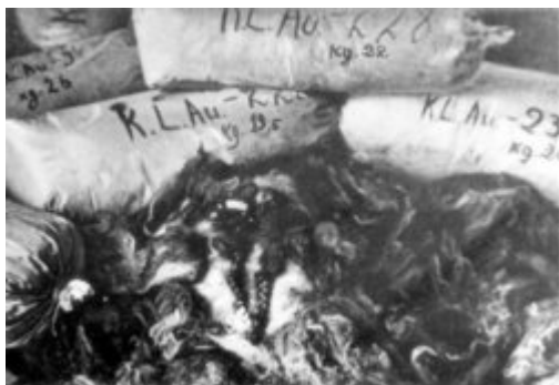
Мішки з волоссям жінок, вбитих у KL Auschwitz-Birkenau. Волосся було запаковане німцями і підготовлене для відправки з метою промислового використання; 1945 р. після визволення табору.