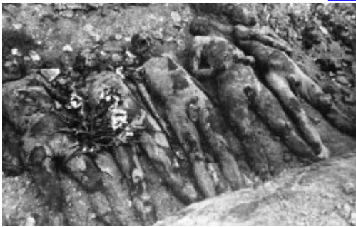
KL Majdanek - відкопані останки в'язнів; серпень 1944 р.