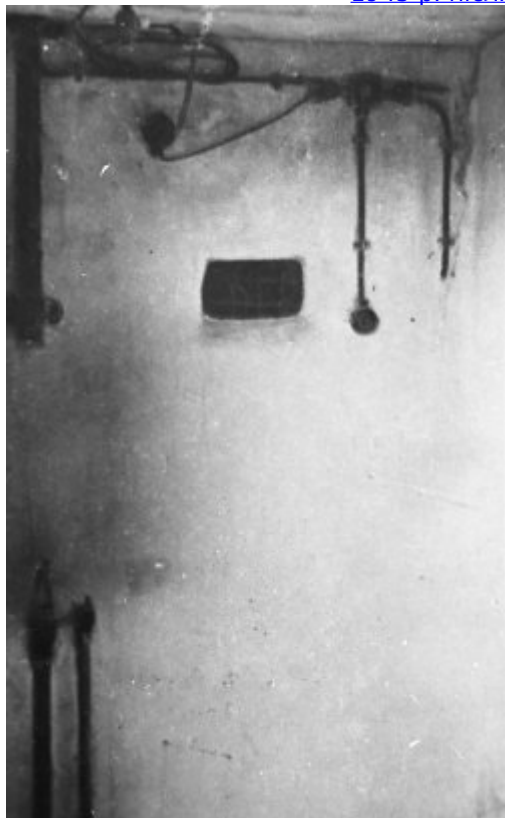
KL Majdanek – приміщення перед газовою камерою з пристроєм для вмикання бутлів з газом. Віконце у стіні дозволяло спостерігати за процесом убивства (IPN).