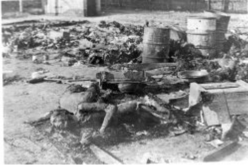
Транзитний табір у Жабікові біля Познані – тіла в'язнів, розстріляних, а потім спалених німцями під час евакуації табору; січень 1945 р. після визволення табору.