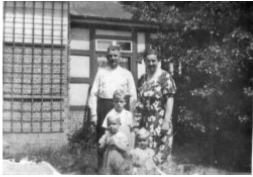
Макс Паулі (нім. Max Pauly) – комендант KL Stutthof з дружиною і дітьми біля свого будинку у Гданську Вжещі; між 1939 і 1942 р..