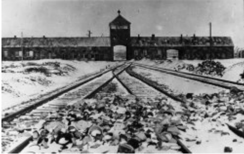
В'їзна брама до KL Auschwitz-Birkenau; січень 1945 р.