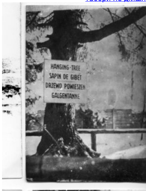
KL Stutthof – ялина, на якій вішали в'язнів; друга половина сорокових (IPN).