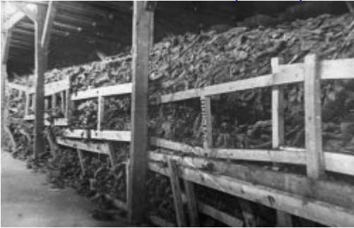
KL Majdanek – стоси взуття в одному з бараків; липень 1944 р. після визволення табору