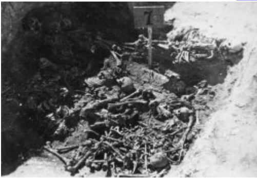
Одна з розкритих могил під час робіт з ексгумації на території KL Majdanek; осінь 1944 р. (IPN)