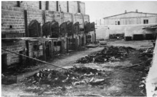
KL Majdanek – залишки обвуглених останків, які лежать біля печей крематорію; липень 1944 р. після визволення табору (IPN)