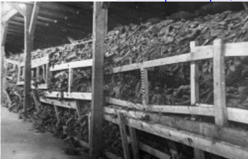
KL Majdanek – стоси взуття в одному з бараків; липень 1944 р. після визволення табору (IPN)