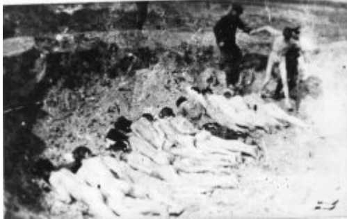
Масова страта в KL Stutthof (IPN)