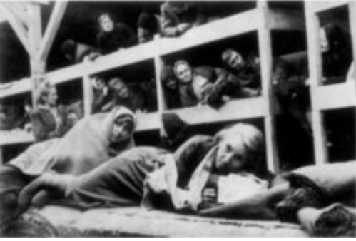
KL Auschwitz-Birkenau - жінки-в'язні всередині бараку; 1945 р.