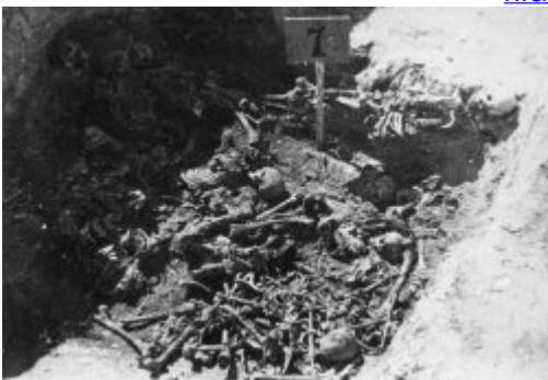
Одна з розкритих могил під час робіт з ексгумації на території KL Majdanek; осінь 1944 р.