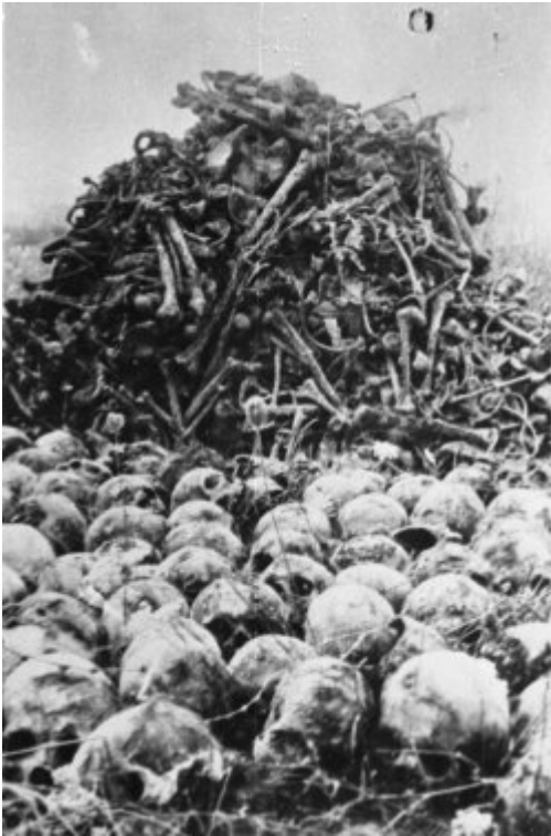
KL Majdanek - черепи і кістки жертв, знайдені під час робіт з ексгумації; осінь 1944 р.