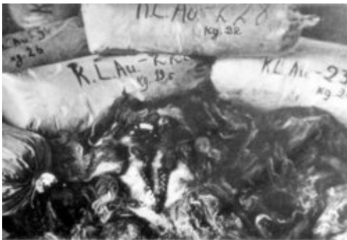
Мішки з волоссям жінок, вбитих у KL Auschwitz-Birkenau. Волосся було запаковане німцями і підготовлене для відправки з метою промислового використання; 1945 р. після визволення табору.