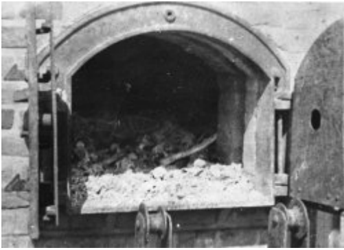
KL Majdanek після визволення у 1944 р. Вміст печі крематорію зі спаленими людськими останками