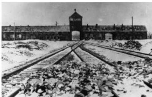
Vstupní brána do KL Auschwitz-Birkenau; leden 1945.