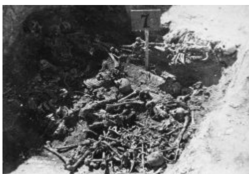
Jeden z hrobů objevených v rámci exhumačních prací v areálu tábora Majdanek (KT Lublin); podzim 1944 (AIPN)