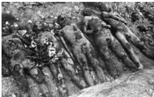
Majdanek (KT Lublin) - vykopané tělesné ostatky vězňů; srpen 1944