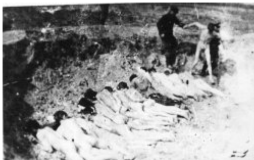
Hromadná poprava v KT Stutthof.