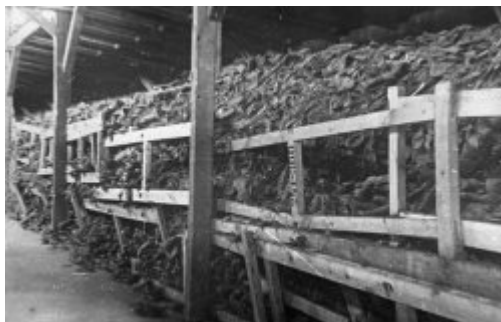
Majdanek (KT Lublin) - zuhelnatělé tělesné ostatky ležící u krematorijních pecí; červenec 1944, po osvobození tábora.