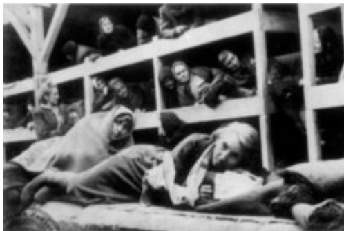
KL Auschwitz-Birkenau - vězenkyně uvnitř baráku; 1945.