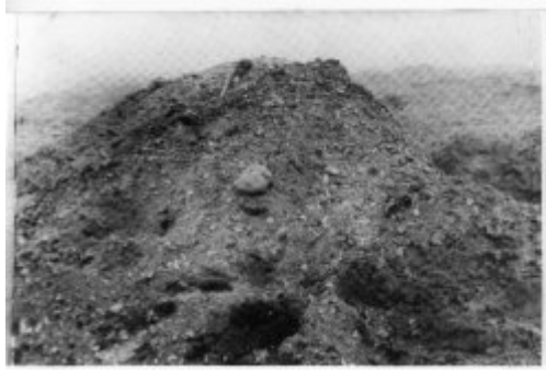
Kopiec popiołów z krematorium na terenie obozu zagłady w Treblince.