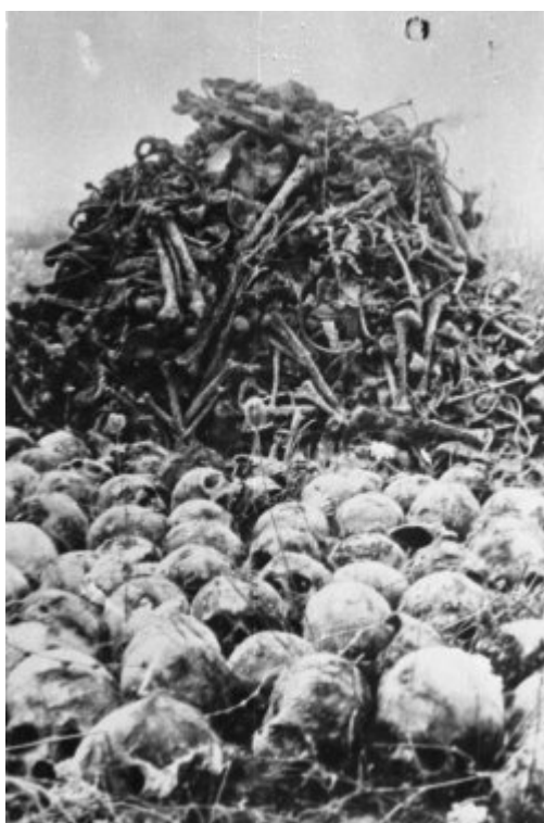
Majdanek (KT Lublin) - lebky a kosti obětí objevené v rámci exhumačních prací; podzim 1944