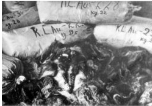
Hromady pytlů s vlasy žen zavražděných v KL Auschwitz-Birkenau. Němci vlasy zabalili a připravili k expedici pro průmyslové účely; 1945, po osvobození tábora