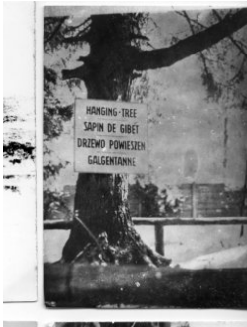
KT Stutthof – smrk, na kterém byli vězni popravováni oběšením; druhá polovina čtyřicátých let. (AIPN)