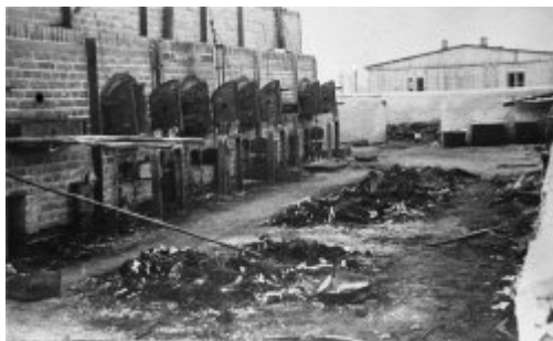
Majdanek (KT Lublin) - zuhelnatělé tělesné ostatky ležící u krematorijních pecí; červenec 1944, po osvobození tábora.