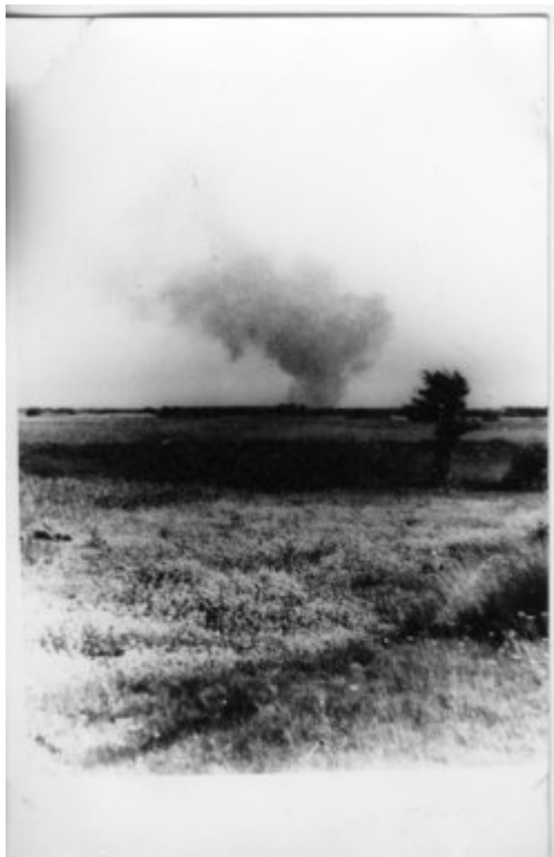
Hromada popela z krematoria v areálu vyhlazovacího tábora Treblinka.