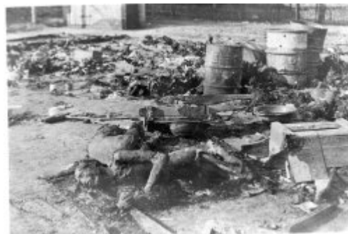
Přechodný tábor v obci Żabików u Poznań – těla osob zastřelených, a následně spálených Němci během evakuace tábora; leden 1945 po osvobození tábora.