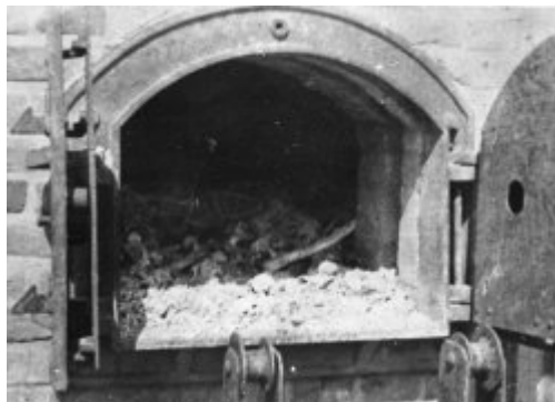
Majdanek (KT Lublin) po osvobození v roce 1944. Vnitřek krematorijní pece se spálenými lidskými ostatky.