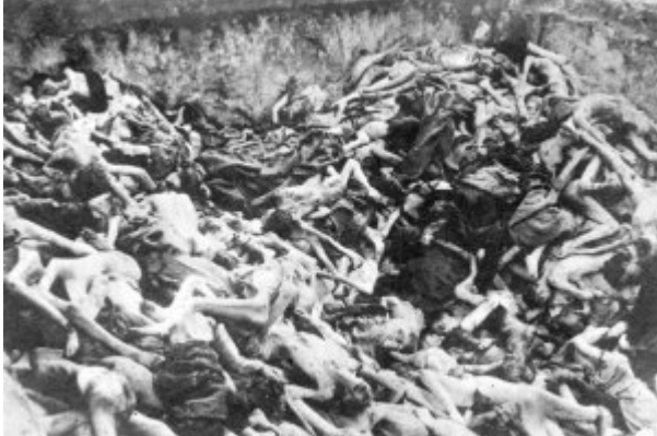
KL Bergen-Belsen – wspólna mogiła pomordowanych więźniów; kwiecień 1945 r. po wyzwoleniu obozu. (IPN)