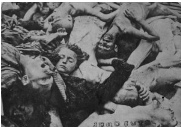
KL Dachau - zwłoki zamordowanych więźniów; kwiecień 1945 r. po wyzwoleniu obozu.