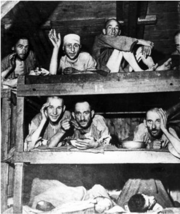
KL Buchenwald - byli więźniowie na pryczach obozowych; kwiecień 1945 r. po wyzwoleniu obozu.