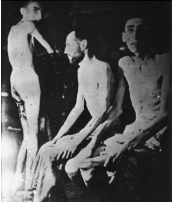
KL Buchenwald – niewolnicy III Rzeszy – wygłodzeni więźniowie; kwiecień 1945 r. po wyzwoleniu obozu.