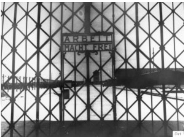
Brama obozowa KL Dachau z napisem „Arbeit macht frei” (Praca czyni wolnym).

W Ravensbrück na więźniarkach, głównie młodych Polkach, przeprowadzano doświadczenia pseudomedyczne polegające na wycinaniu części kości nóg.