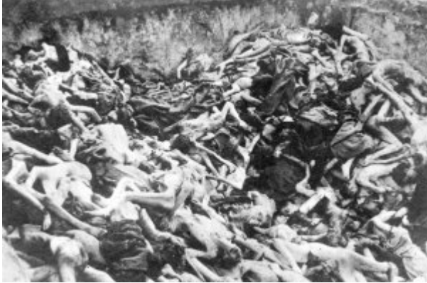
KL Bergen-Belsen – wspólna mogiła pomordowanych więźniów; kwiecień 1945 r. po wyzwoleniu obozu.