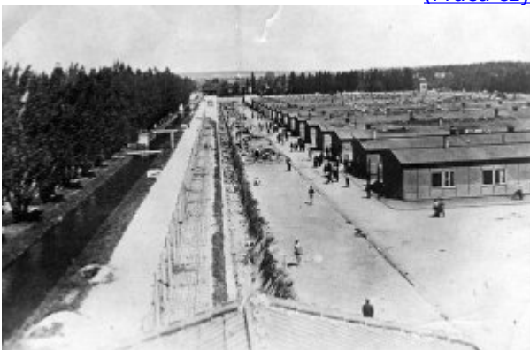
KL Dachau - widok ogólny na baraki, w których mieszkali więźniowie, ogrodzenie z drutu kolczastego, przez który przepływał prąd elektryczny o wysokim napięciu, obok baraków więźniowie; kwiecień 1945 r.