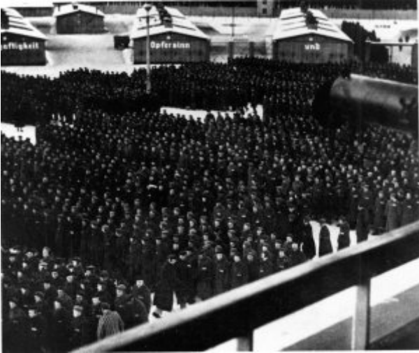
KL Sachsenhausen - apel na placu obozowym (apelowym), w tle na barakach fragment napisu prawdopodobnie o następującej treści: „Es gibt nur einen Weg zur Freiheit, seine Meilensteine heissen: Gehorsam - Fleiss - Ehrlichkeit - Ordnung - Sauberkeit - Nüchtern