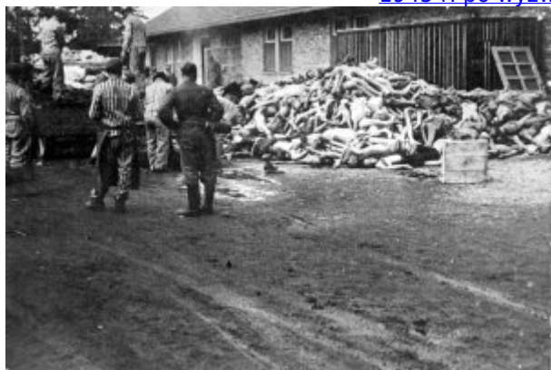
KL Dachau - więźniowie rozładowują z platformy ciała pomordowanych, na drugim planie budynek krematorium; 1945 r.