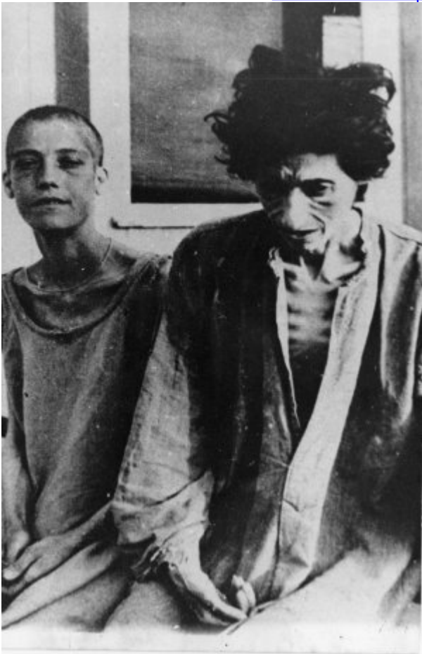
Więżniarki KL Ravensbrück; 1945 r. po wyzwoleniu obozu.